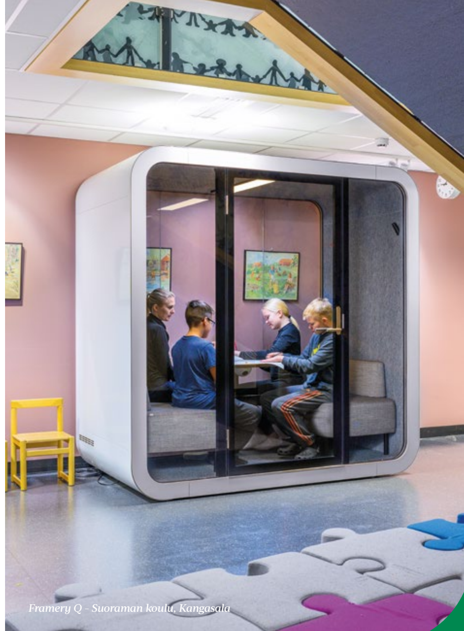
Framery Q - Suoraman koulu, Kangasala